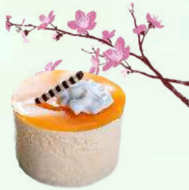
Crema catalana 4.95€