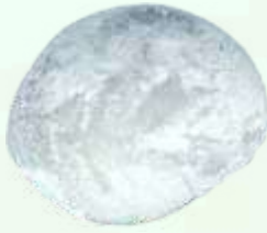
Sakura mochi to ocha (Pastel de arroz relleno de dulce de judía roja acompañado de té japonés) 4.95€