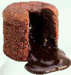
Souffle de chocolate y almendras 4.95€