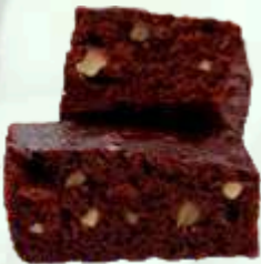
Brownie de nueces 4.95€