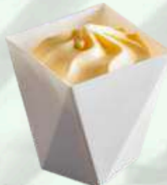
Copa helado vainilla 2.35€