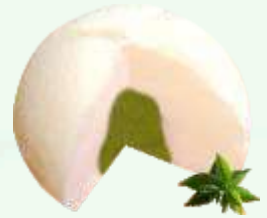
Mochi helado de té verde 4.95€