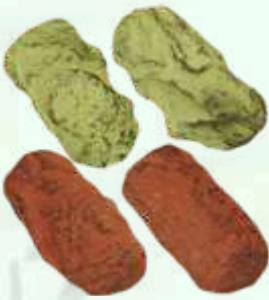
Trufas: té verde y sake 4.50€