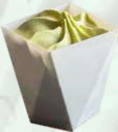
Copa helado té verde 2.35€