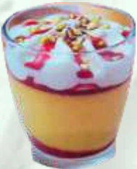
Vaso sorbete mango 5.95€