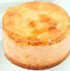
Mini pastel de queso 4.95€