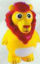
Leony (chocolate) 4.95€