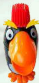
Pinguino (vainilla) 4.95€