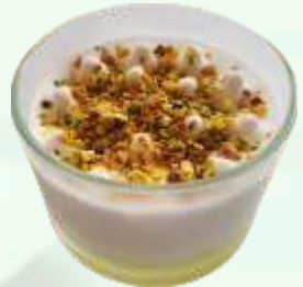
Sorbete de limón 5.95€