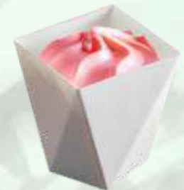
Copa helado fresa 2.35€