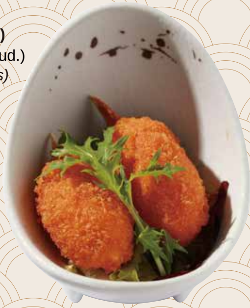
43 Pinzas de cangrejo fritas (2ud.) Pinces de cranc fregides (2ud.) Fried crab claws (2units) Alérgenos: 5.10.12