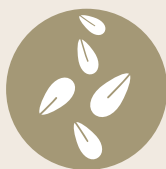
11. Granos de sésamo