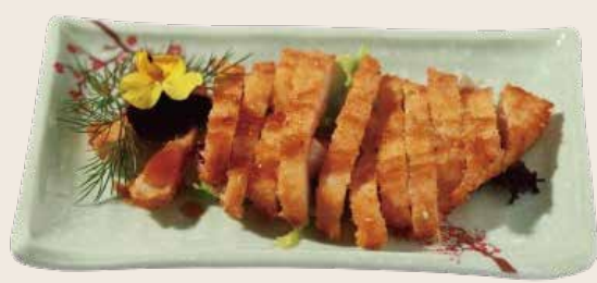
40 Pollo rebozado Pollastre arrebossat Breaded chicken Alérgenos: 10.11.12