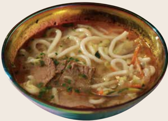
3 Sopa de udon con ternera y verduras Sopa d'udon amb vedella i verdures Udon soup with beef and vegetables Alérgenos: 10