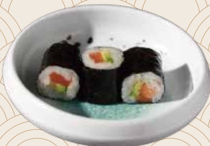
103 Aguacate y salmón (3ud.) Alvocat i salmó (3ud.) Avocado and salmon (3units) Alérgenos: 2