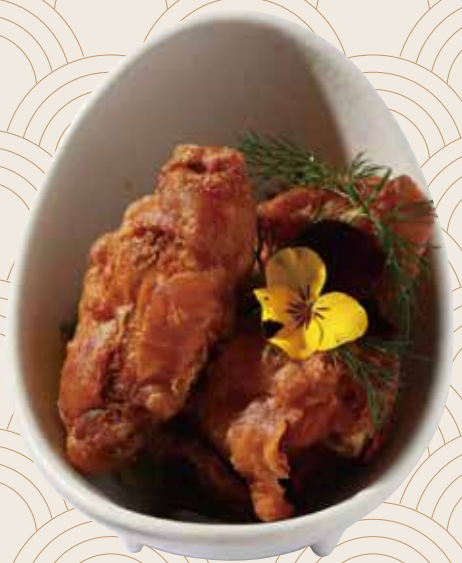
41 Alitas de pollo (3ud.) Aletes de pollastre (3ud.) Chicken wings (3units) Alérgenos: 1.10