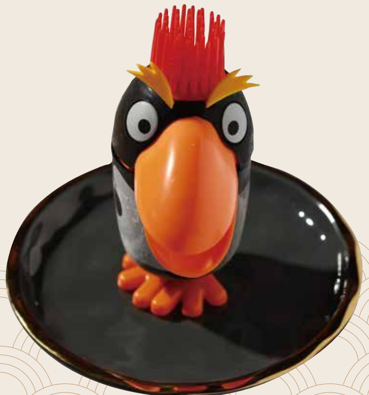
P21 Pinguino Pinguino Pinguino 4.50€