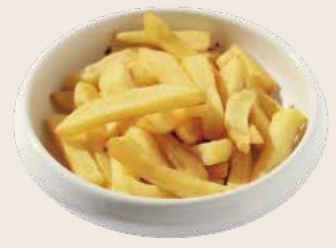
39 Patatas fritas Patates fregides Chips Alérgenos: 10