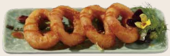
38 Calamares romana (4ud.) Calamars romana (4ud.) Roman squid (4units) Alérgenos: 10.12