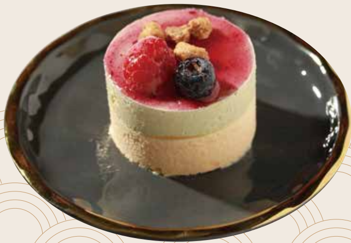
P6 Vanilla, té verde y frutas del bosque Vanilla, te verd i fruites del bosc Vanilla, green tea and berries 4.50€