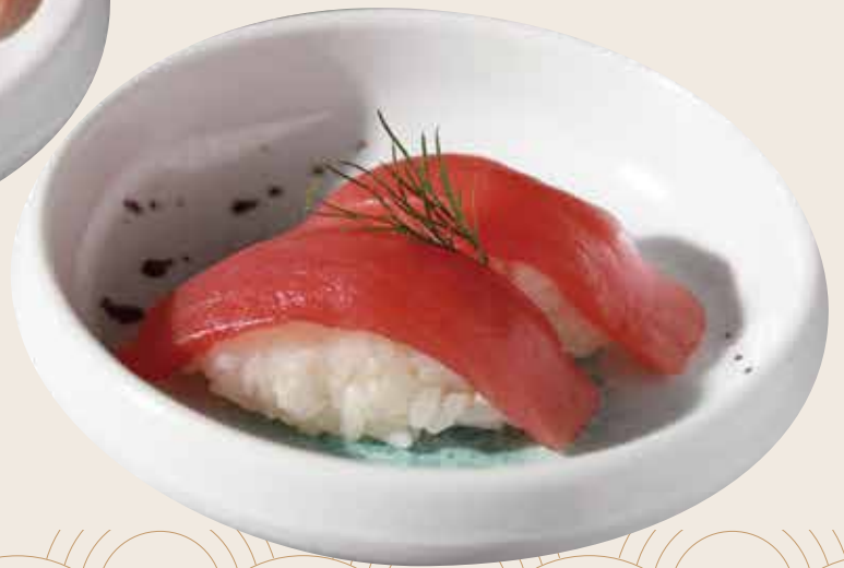
108 Atún (2ud.) Tonyina (2ud.) Tuna (2units) Alérgenos: 2