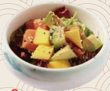
8 Ensalada de frutas Amanida de fruites Fruit salad Alérgenos: 1.10.11