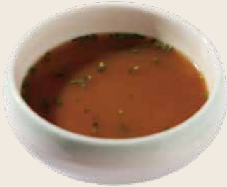
1 Sopa de miso Sopa de miso Miso soup Alérgenos: 1.10