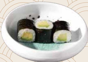
102 Aguacate (3ud.) Alvocat (3ud.) Avocado (3units) Alérgenos: