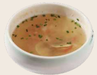
2 Sopa de marisco Sopa de marisc Seafood soup Alérgenos: 2.5.8.10