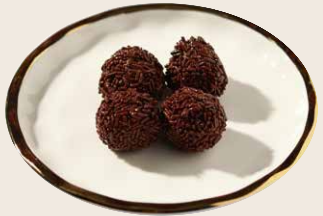
P19 Trufas Tòfones truffles 4.50€