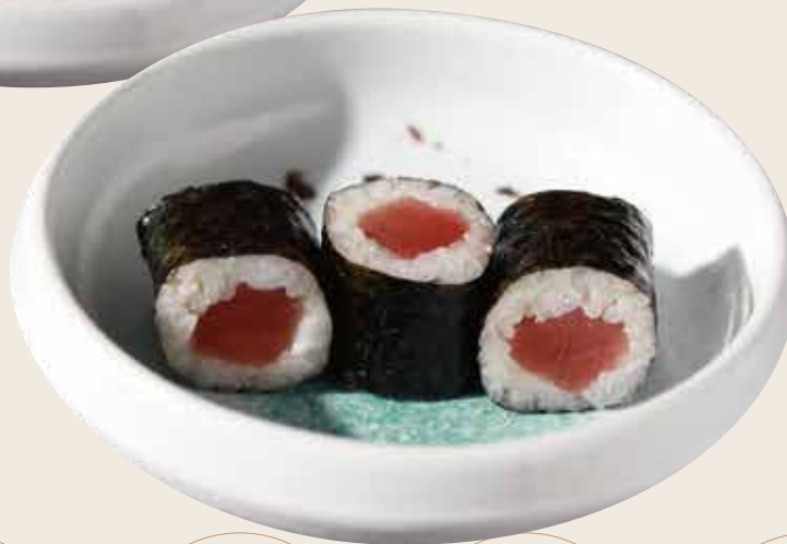
101 Atún (3ud.) Tonyina (3ud.) Tuna (3units) Alérgenos: 2