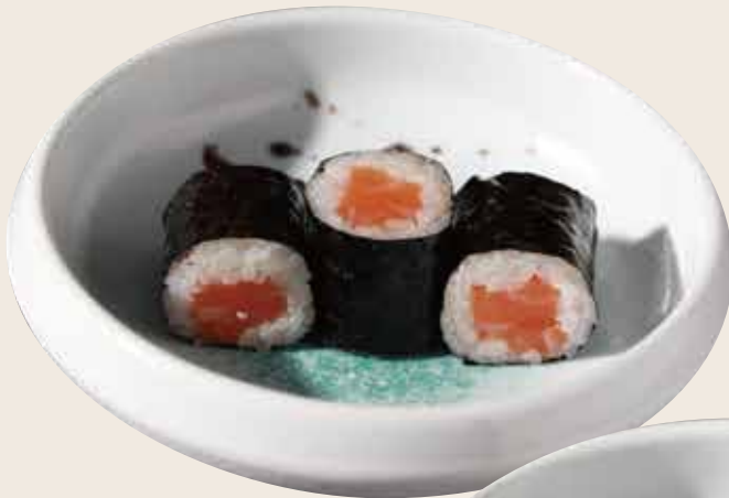
100 Salmón (3ud.) Salmó (3ud.) Salmon (3units) Alérgenos: 2