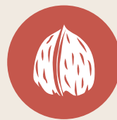
4. Frutos de cáscara