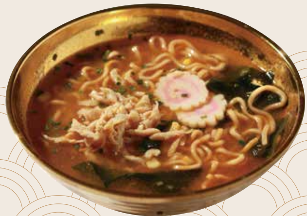
5 Miso ramen con pollo y verduras Miso ramen amb pollastre i verdures Miso ramen with chicken and vegetables Alérgenos: 1.10.13