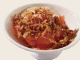
11 Ensalada de salmón y guacamole Amanida de salmó i guacamole Salmon and guacamole salad Alérgenos: 1.2.3.4.6.10