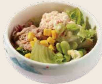
7 Ensalada de la casa Amanida de la casa Homemade salad Alérgenos: 1.2.5.6.10