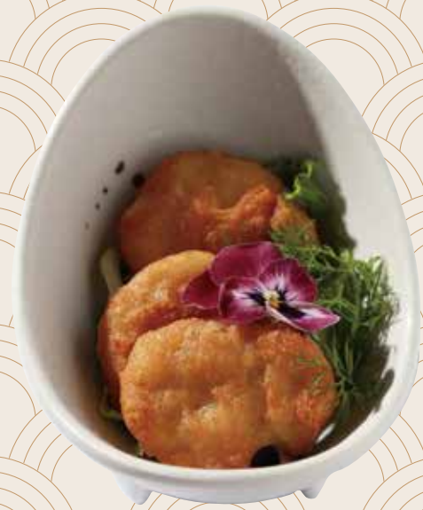
42 Nuggets (3ud.) Nuggets (3ud.) Nuggets (3units) Alérgenos: 10.12