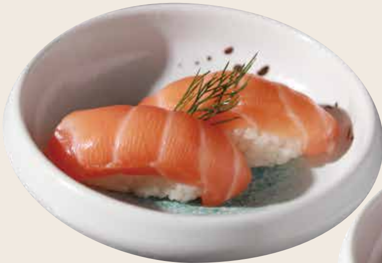
106 Salmón (2ud.) Salmó (2ud.) Salmon (2units) Alérgenos: 2