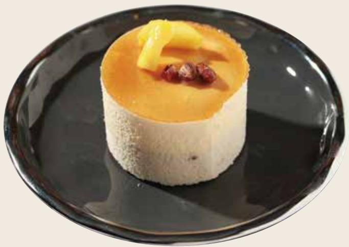
P5 Mango y judia Mànec i mongeta Mango and bean 4.50€