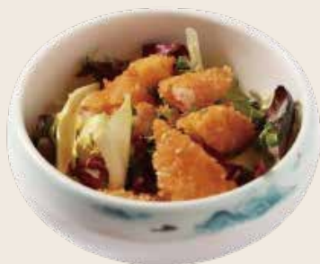
10 Ensalada de langostinos en tempura Amanida de llagostins en tempura Prawn tempura salad Alérgenos: 1.6.9.10