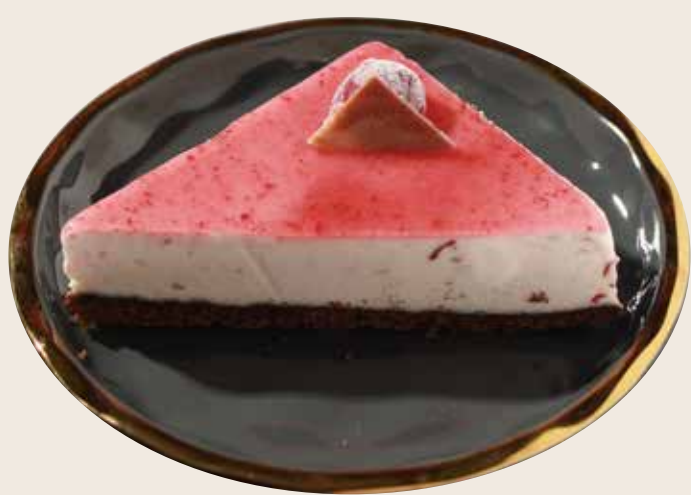
P4 "Fuji" Cereza sakura "Fuji" Cirera sakura "Fuji" Sakura Cherry 4.50€