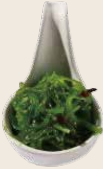
6 Wakame Wakame Wakame Alérgenos: 11