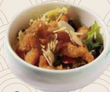
9 Ensalada de pollo con almendras Amanida de pollastre amb ametlles Chicken salad with almonds Alérgenos: 1.4.6.10