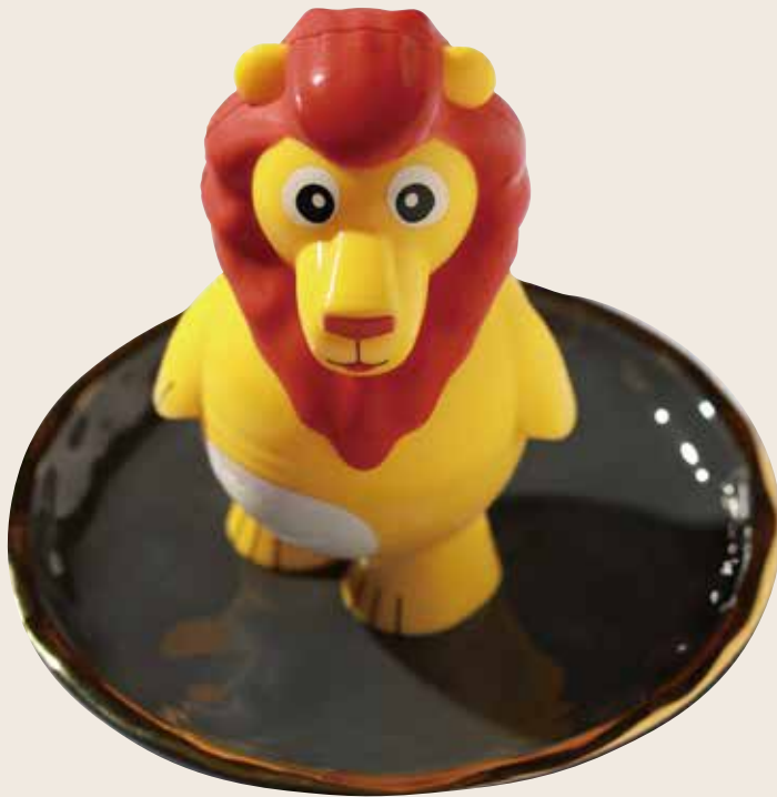
P20 Leony Leony Leony 4.50€