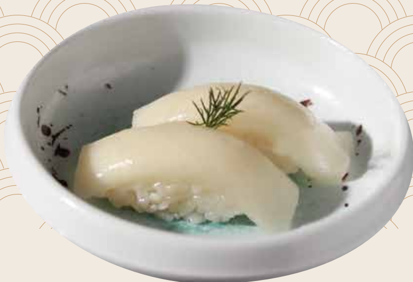
107 Pez mantequilla (2ud.) Peix mantega (2ud.) Butterfish (2units) Alérgenos: 2