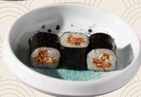
105 Cebolla frita y queso (3ud.) Ceba fregida i formatge (3ud.) Fried onion and cheese (3units) Alérgenos: 4.6