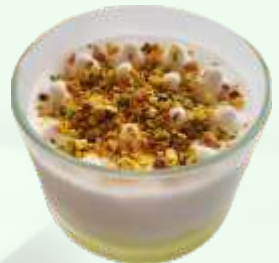
Sorbete de limón 5.95€