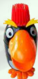
Pinguino (vainilla) 4.95€