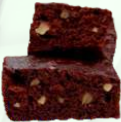
Brownie de nueces 4.95€