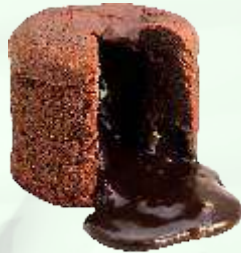
Souffle de chocolate y almendras 4.95€