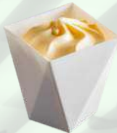
Copa helado vainilla 2.35€