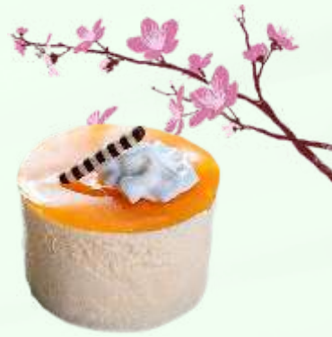
Crema catalana 4.95€