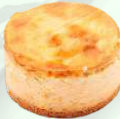
Mini pastel de queso 4.95€