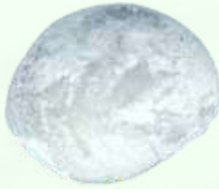
Sakura mochi to ocha (Pastel de arroz relleno de dulce de judía roja acompañado de té japonés) 4.95€