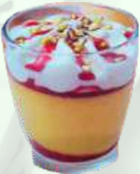
Vaso sorbete mango 5.95€