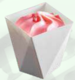
Copa helado fresa 2.35€