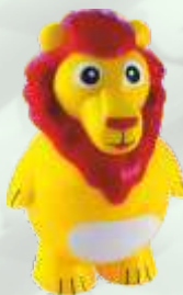
Leony (chocolate) 4.95€