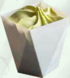
Copa helado té verde 2.35€