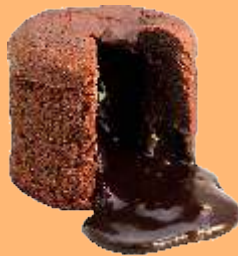
Souffle de chocolate y almendras 4.95€