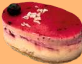
Coco y frutas del bosque 4.95€