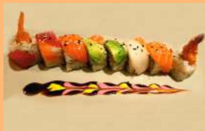
C5. Rainbow uramaki Tempura de gambas, atún, salmón pez blanco y aguacate Tempura de gambes, tonyina, salmó, peix blanc i alvocat