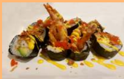
C2. Kani maki Cangrejo de concha blanda, aguacate tobiko y salsa mayonesa Cranc de closca tova, alvocat, tobiko i salsa maionesa