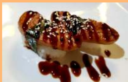
C7. Kanzo nigiri Foie y salsa teriyaki Foie i salsa teriyaki