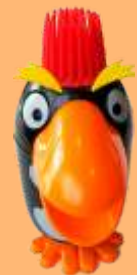
Pinguino (vainilla) 4.95€