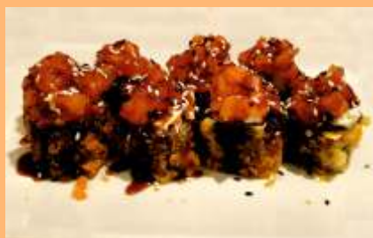
C6. Mini uramaki Tempura de uramaki, salmón, queso y salsa de anguila Tempura de uramaki, salmó, formatge i salsa de anguila