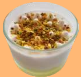
Sorbete de limón 5.95€