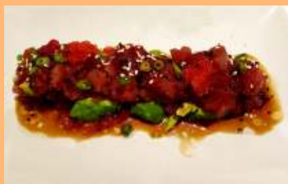
C1. Tartar maguro atún, aguacate y tobiko Tonyina, alvocat i tobiko