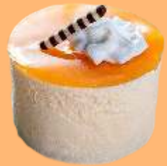
Crema catalana 4.95€