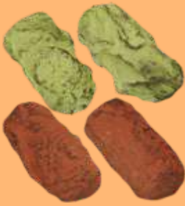
Trufas: té verde y sake 4.95€