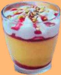
Vaso sorbete mango 5.95€