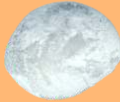
Sakura mochi to ocha (Pastel de arroz relleno de dulce de judía roja acompañado de té japonés) 4.95€