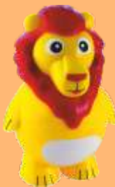
Leony (chocolate) 4.95€