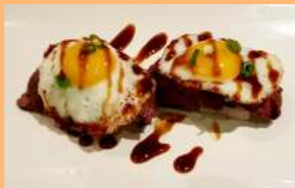
C3. Uzura no tamago Solomillo y huevos de codorniz Filet i ous de guatlla