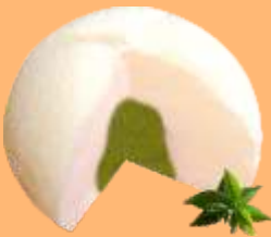
Mochi helado de té verde 4.95€