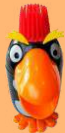
Pinguino (vainilla) 4.95€