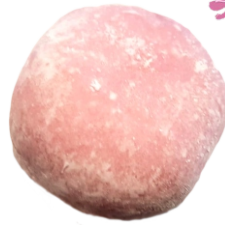
Sakura mochi to ocha (Pastel de arroz relleno de dulce de judía roja acompañado de té japonés) 4.95€