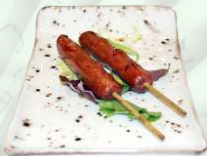
76. Pincho de frankfurt (2u.) Pinxo de frankfurt