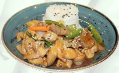
87. Arroz con pollo y ternera Arròs amb pollastre i vedella