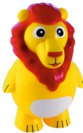
Leony (chocolate) 4.50€