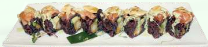
113. Tokyo / Tokyo (8u.) Arroz negro, langostino frito, aguacate, salmón, almendra y salsa rúcula