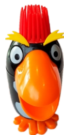
Pinguino (vainilla) 4.50€