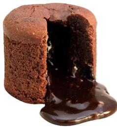
Souffle de chocolate y almendras 4.95€