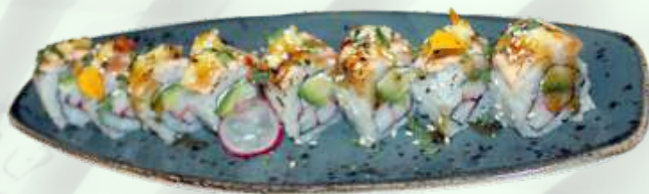
116. Omega / Omega (8u.) Surimi, aguacate, queso, salmón flameado, mayonesa y salsa teriyaki