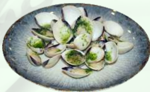
75. Almejas a la plancha Cloïsses a la planxa