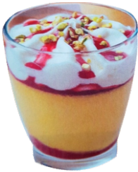
Vaso sorbete mango 5.95€