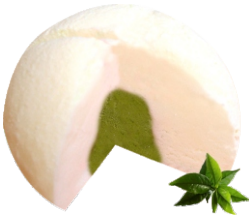
Mochi helado de té verde 4.95€