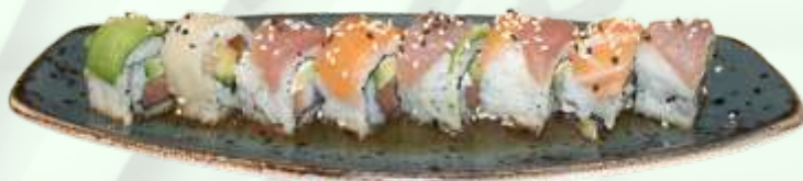
115. Rainbow / Rainbow (8u.) Salmón, aguacate, queso, atún, pez mantequilla. sésamo y salsa ponzu