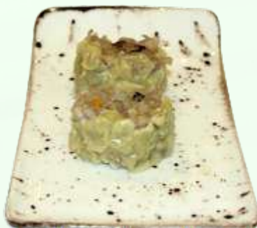
72. Saumai con cerdo (2u.) Saumai amb porc