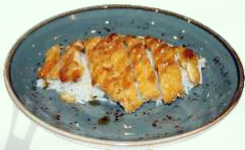
85. Arroz con pollo frito y salsa teriyaki Arròs amb pollastre fregit i salsa teriyaki