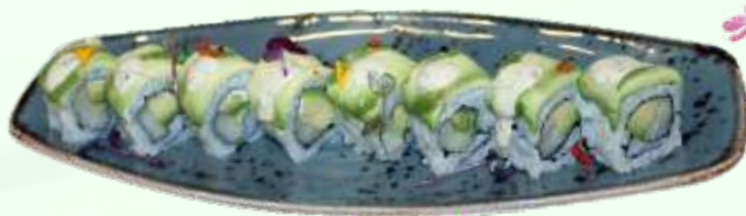
112. Trufa / Tófona (8u.) Pez mantequilla, aguacate, queso y salsa trufa