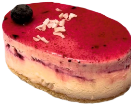
Coco y frutas del bosque 4.95€