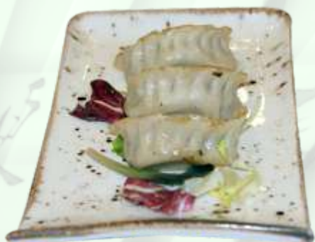
73. Empanadilla con cerdo (3u.) Crestes amb porc