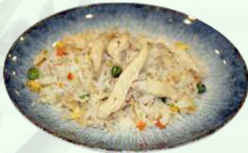
88. Arroz frito con pollo Arròs fregit amb pollastre