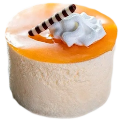
Crema catalana 4.95€