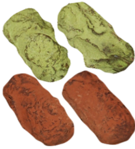
Trufas: té verde y sake 4.95€