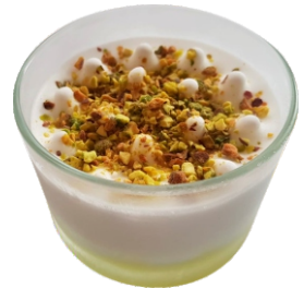
Sorbete de limón 5.95€