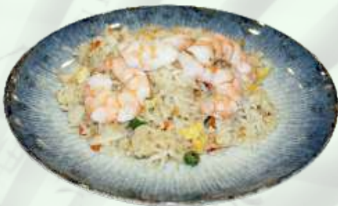
89. Arroz frito con gambas Arròs fregit amb gambes