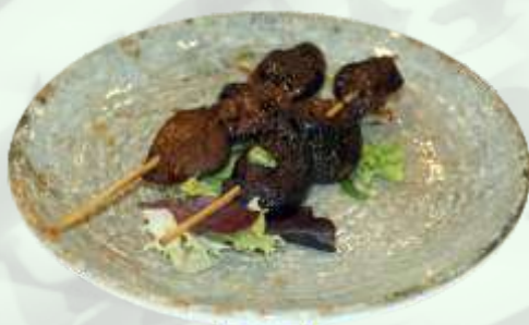
77. Pincho de setas (2u.) Pinxo de bolets