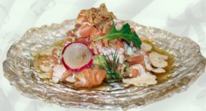
8. Ensalada salmón y aguacate Amanida salmó i alvocat