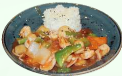
86. Arroz con langostinos y salsa picante Arròs amb llagostins i salsa picant