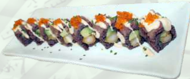
117. Flamenco / Flamenco (8u.) Arroz negro, langostino frito, aguacate, atún, tobiko y salsa picante