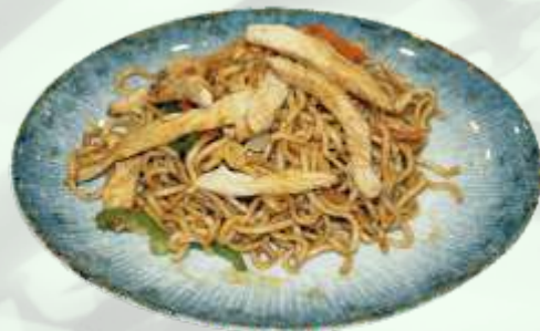
90. Tallarines a la plancha con pollo Tallarines a la planxa amb pollastre