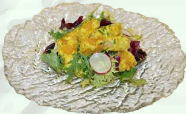
7. Ensalada langostino frito Amanida llagostí fregit